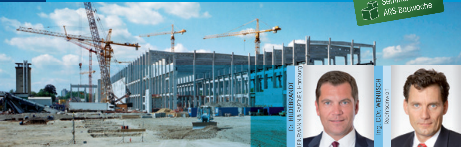
Dr. HILDEBRANDT LEINEMANN & PARTNER, Hamburg